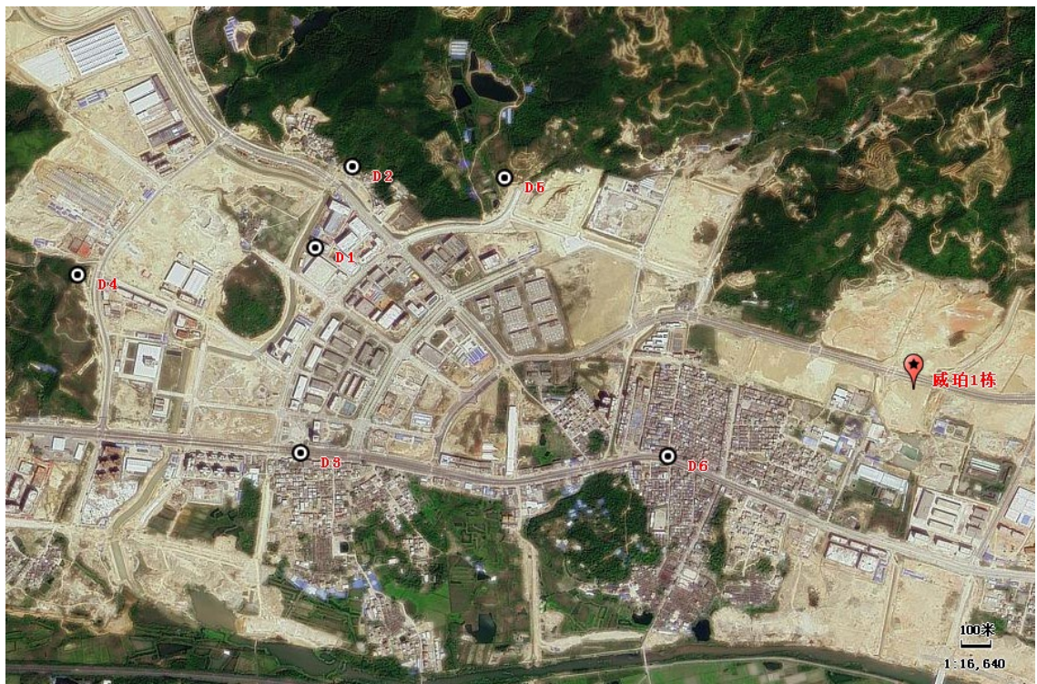
图 3-1 地下水监测点位与本项目的位位置图